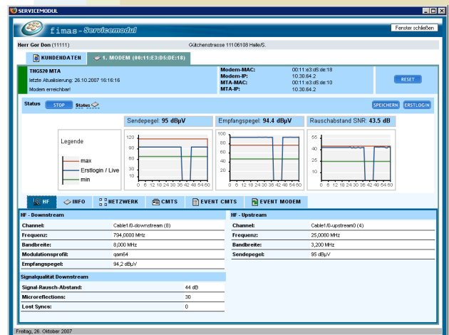
Bild: Modemdaten mit Livechart